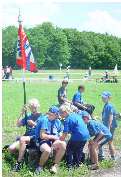
Der Wettkampf ist vorbei, der Tag noch lange nicht.

Die Rangierung erfolgt in verschiedenen Stärkeklassen, abhängig von der durchschnittlich eingesetzten Turnern pro Wettkampfteil. Mit durchschnittlich 31 Turnern wurden wir in der 2. Stärkeklasse klassiert und belegten dort den Rang 27 von 31 Jugend-Sektionen. Wie bereits angedeutet war eine gute Rangierung kein primäres Ziel, sondern dass jeder möglichst viele Einsätze hat. Als zweitbeste Thurgauer Sektion in der 2. Stärkeklasse sind wir mit den Ergebnissen zufrieden.