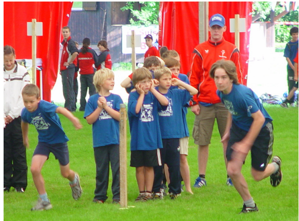
Der Startschuss zur Pendelstafette war laut